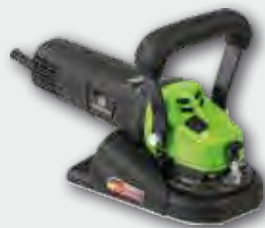
EOF 100.1 1.400 W; 10.000 min -1 ; Ø 100 mm