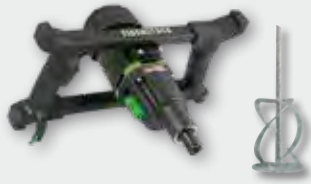
EHR 20/2.6 S Set 1.300 W; 0-400/0-730 min -1 ; Ø 140 mm; Rührgutmenge 50 kg