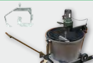
Automix 90 1.500 W; 115 min -1 ; 90 l; Rührgutmenge 80 kg