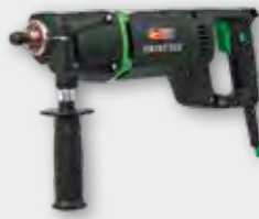
EHD 1500 1.500 W; 0-3.700 min -1 ; Ø 32-82 mm