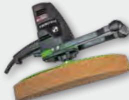
EPG 400 500 W; 0-110 min -1 ; Ø 370 mm