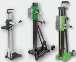
weitere Modelle auf Anfrage