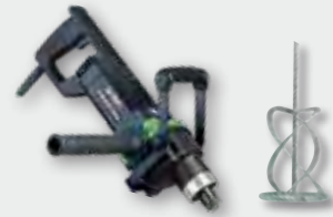
EHR 162 S Set 2.000 W; 0-800 min -1 ; Ø 180 mm; Rührgutmenge 80 kg