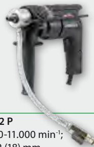
END 712 P 700 W; 0-11.000 min -1 ; Ø 3,5-12 (18) mm