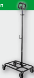
EFW für Langhalssschleifer ELS 125 D und ELS 225.1