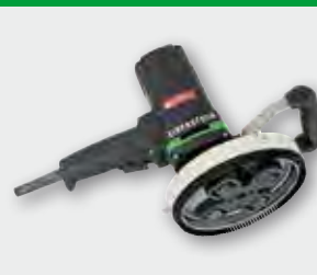
EPF 1503 1.500 W; 4.000 min -1 ; Ø 140 mm