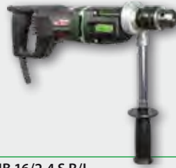
EHB 16/2.4 S R/L 1.150 W; 0-700/0-1.200 min -1 ; Ø 20 mm in Stahl