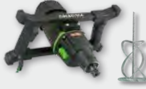
EHR 23/2.5 S Set 1.800 W; 0-440/0-970 min -1 ; Ø 180 mm; Rührgutmenge 80 kg