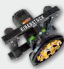
EBS 125.4 O/125.4 RO 1.500 W; 10.000/6.000-10.000 min -1 ; Ø 125 mm