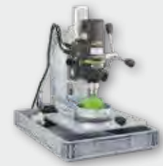
EFB 152 PX (mit Pumpe) 1.150 W; 250-1.000 min -1 ; Ø 6-120 mm