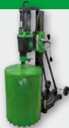
DBE 352 3.000 W; 230/500/1.030 min -1 ; Ø 42-352 mm