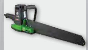
EDB 480.1 1.800 W; 3.100 Hübe/min; Schnittlänge 480 mm