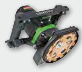
EBS 180 H 2.500 W; 8.500 min -1 ; Ø 180 mm