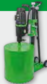
PowerLine PLE 450 B 3.300 W; 300/650/1.300 min -1 ; Ø 71-450 mm