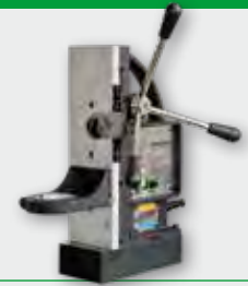
B 32.1 110 W; Magnethaltekraft 16 KN; Spannhals-Ø 65 mm; Hub 180 mm