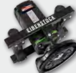
EBS 1802 SH 1.800 W; 10.000 min -1 ; Ø 125 mm