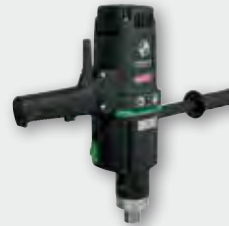
EHB 32/4.2 1.700 W; 215/330/460/680 min -1 ; Ø 32 mm in Stahl