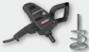
EHR 14.1 SK Set 960 W; 0-590 min -1 ; Ø 120 mm; Rührgutmenge 30 kg