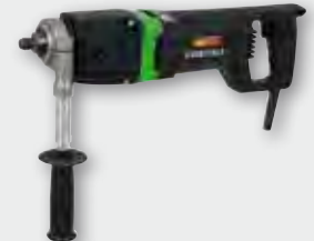
EHD 2000 S 1.700 W; 0-1.500/0-3.000 min -1 ; Ø 32-132 mm