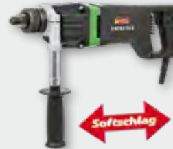
ESD 1801 1.800 W; 0-3.000 min -1 ; Ø max. 90 mm