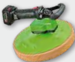
EPG 400 A 18 V, 5,2 Ah Li-Ionen; 80 min -1 ; Ø 370 mm