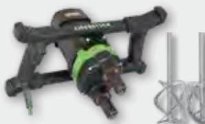
EZR 24 R R/L Set 1.800 W; 180-440 min -1 ; Ø 230 mm; Rührgutmenge 80 kg