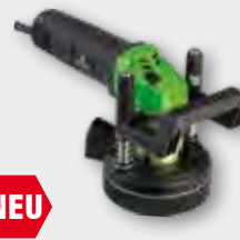
EFB 68 1.400 W; 3000-10000 min -1 ; Ø 20-68 mm