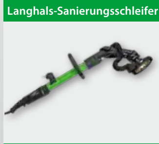
ELS 125 D 1.200 W; 8.000 min -1 ; Ø 125 mm