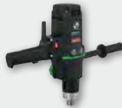
EHB 32/2.2 R R/L 1.800 W; 60-140/200-470 min -1 ; Ø 32 mm in Stahl