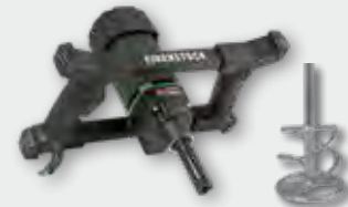
EHR 18.1 S Set 1.100 W; 0-800 min -1 ; Ø 120 mm; Rührgutmenge 40 kg