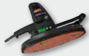
EWS 400 800 W; 0-140 min -1 ; Ø 370 mm