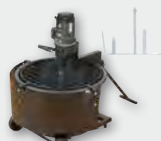
Automix 1801 1.500 W; 115 min -1 ; 65 l; Rührgutmenge 50 kg