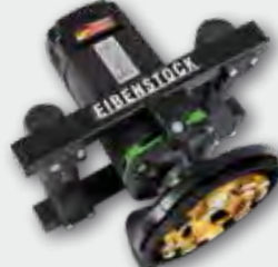
EBS 1802 1.800 W; 10.000 min -1 ; Ø 125 mm