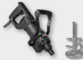
EHR 15.2 SB Set 1.050 W; 0-800 min -1 ; Ø 120 mm; Rührgutmenge 40 kg