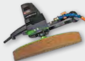
EPG 400 WP 500 W; 0-110 min -1 ; Ø 370 mm