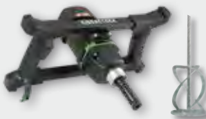
EHR 20.1 R Set 1.300 W; 250-580 min -1 ; Ø 140 mm; Rührgutmenge 50 kg