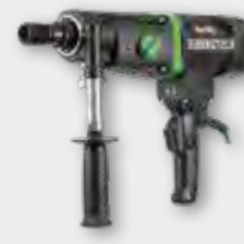
PowerLine PLD 182.1 NT 2.300 W; 0-1.000/-2.200/-4.000 min -1 ; Ø 12-182 (202) mm