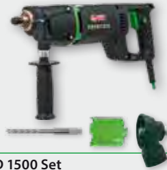
EHD 1500 Set 1.500 W; 0-3.700 min -1 ; Ø 32-82 mm