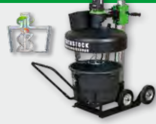
TwinMix 1800 T 1.800 W; 250/450 u. 20/36 min -1 ; 65 l; Rührgutmenge 50 kg