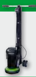
EBS 235.1 2.200 W; 1.380 min -1 ; Ø 235 mm