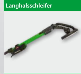
ELS 225.1 590 W; 1.050-1.600 min -1 ; Ø 225 mm