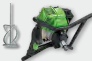
EHR 750 B 0,75 kW/1,0 PS; 0-450 min -1 ; Rührgutmenge 80 kg