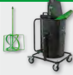
FloorMix 2300 2.300 W; 70/130/160/280 min -1 ; 110 l; Rührgutmenge 150 kg