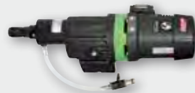
EBM 250/2 RP 2.500 W; 360/850 min -1 ; Ø 52-250 mm