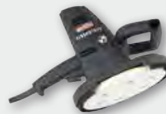
ETS 225 700 W; 0-2.300 min -1 ; Ø 225 mm