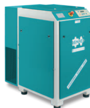
RS 18,5 – 55,0