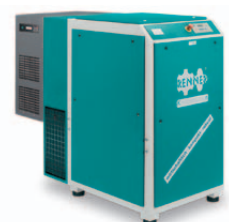
RSK 18,5 – 45,0