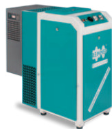
RSK-TOP 3,0 – 15,0