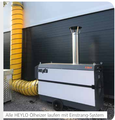
Alle HEYLO Ölheizungen laufen mit Einstrang-System

Laut der TRwS 791 sind neue Ölheizanlagen nur noch im Einstrang-Betrieb zulässig. Außerdem wird empfohlen, alte Zweistrang-Systeme auf Einstrang umzubauen. Im Einstrang-Betrieb wird das Risiko einer Ölleckage sehr stark reduziert. Im Falle einer Leckage der Ölleitung zwischen Heizgerät und Tank kann nur im Zweistrang-Betrieb das rückgeführte Öl in die Umwelt gelangen und zu großen Schäden führen. HEYLO liefert alle Warmluftgeräte im Einstrang-System aus. Alte Heizungen lassen sich mit einem Umrüstsatz einfach auf das neue System umrüsten, so dass Sie mit Ihren Ölheizern auf der sicheren Seite sind. Sprechen Sie uns einfach an!