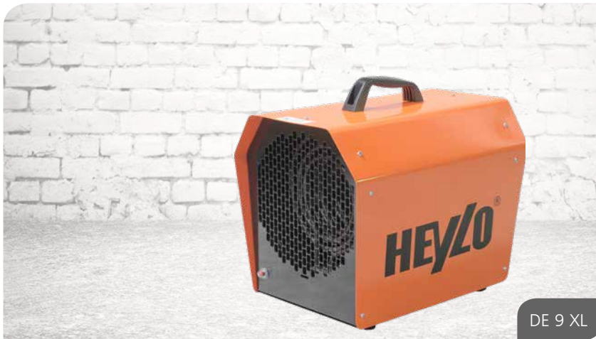
DE 9 XL